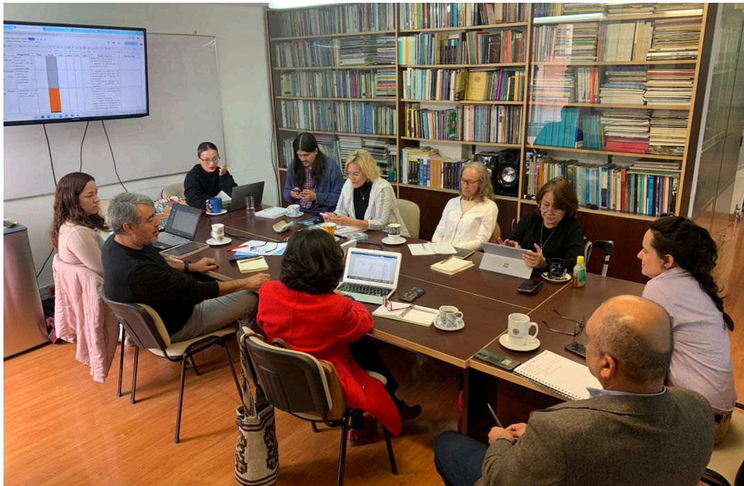
Equipo de trabajo sentencia UP. Corporación Reiniciar.

Si su nombre y número de identificación no se despliega en el listado del formulario de la UARIV, significa que debe acudir a la Comisión de verificación de identidad y/o parentesco, por favor remitir su solicitud de verificación de identidad y parentesco al correo electrónico: radicacion@comisionidentificacionup.co