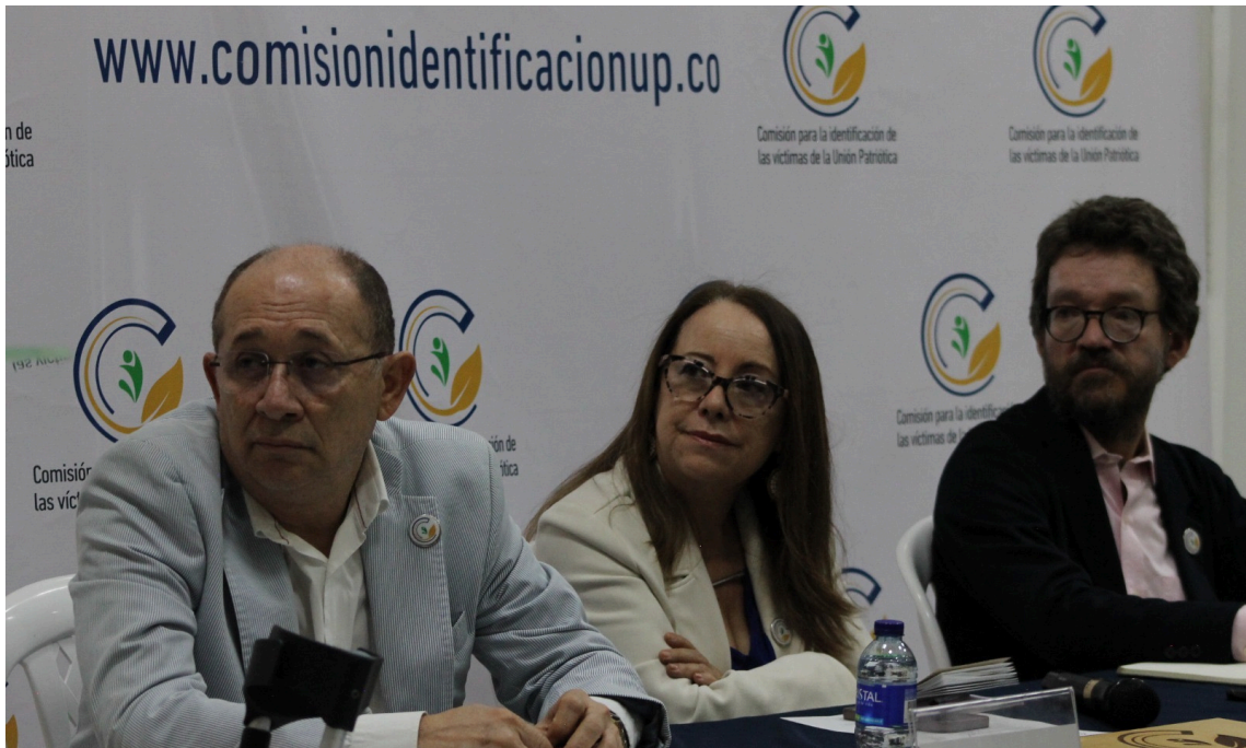
Comisionados para la constatación de identidad y parentesco del caso Unión Patriótica

La Corporación Reiniciar le informa a las víctimas listadas en los anexos de la sentencia que ya están llegando los radicados tanto de la UARIV (víctimas Anexo I), como de la Comisión para la constatación de identidad y parentesco (víctimas Anexos II y III).