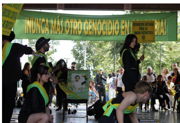
Foro Universidad de Caldas