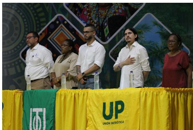
Foro Universidad Tecnológica del Chocó