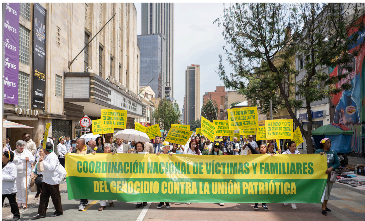
Marcha por la Dignidad de las Víctimas y Familiares del Genocidio contra la UP. 2022.

Este 11 de octubre de 2024, conmemoramos 20 años de resistencia al negacionismo, a la indiferencia y al genocidio. Hace 20 años decidimos organizarnos de forma permanente y trabajar a la vez por justicia para la UP y por el reconocimiento del Día Nacional por la Dignidad de las Víctimas del Genocidio contra la Unión Patriótica .