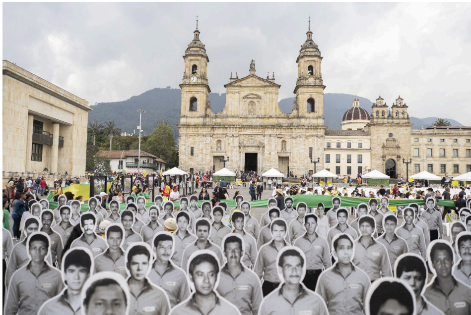
Encuentro Nacional por la Dignidad de las Víctimas y Familiares del Genocidio contra la UP. 2022.