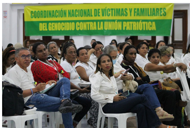
Foro Universidad de Córdoba