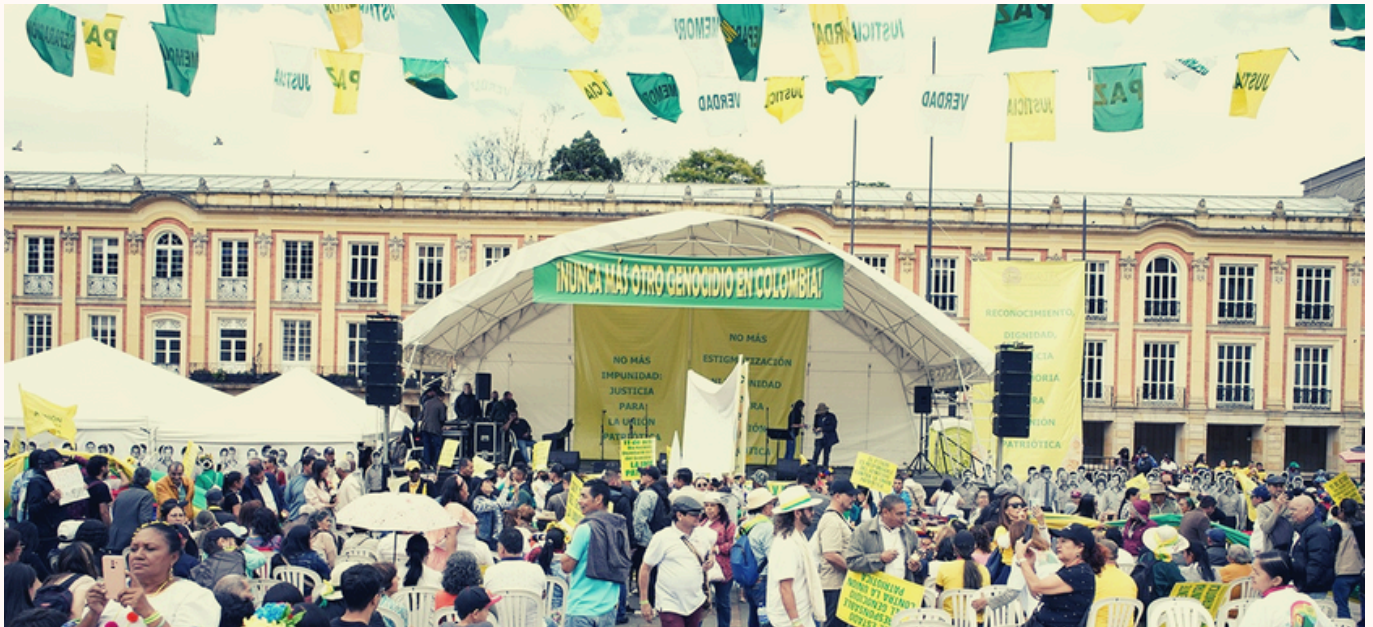
Foto: Conmemoración XIX Encuentro por dignidad de las víctimas. 11 Octubre 2023.

BOLETÍN INFORMATIVO DEL CASO 06 -UP- EN LA JEP - N.15