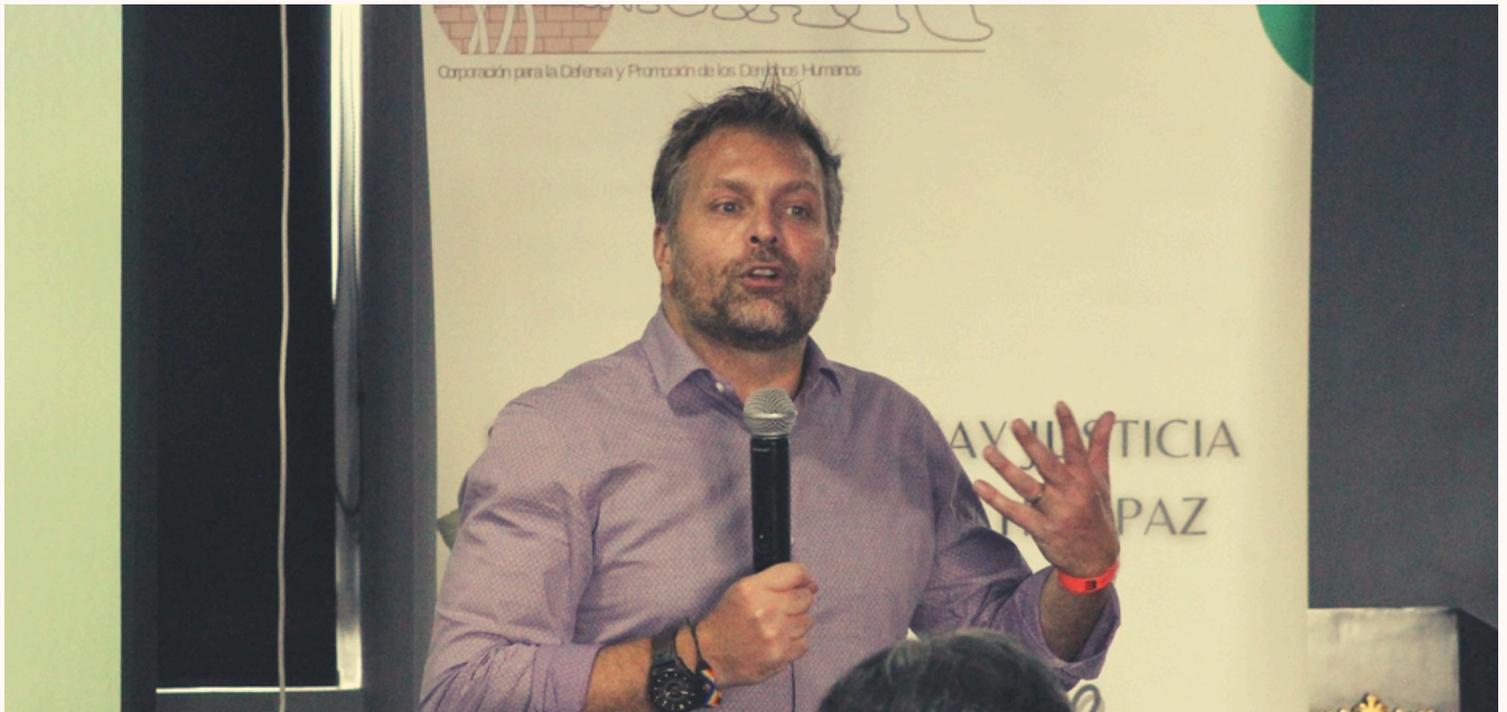
Foto: Taller sobre lineamientos TOAR. 19 y 20 Enero 2024

BOLETÍN INFORMATIVO DEL CASO 06 -UP- EN LA JEP - N.16