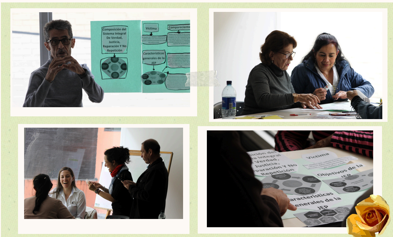
Fotografías Reunión informativa con víctimas acreditadas en la JEP - 10 Octubre 2023

El espacio compartido, le permitió al equipo y a las víctimas generar mayores claridades, identificar aspectos que deben continuar trabajándose en profundidad sobre los momentos procesales en la JEP, y enriquecer el debate sobre la justicia, la restauración y la reconciliación. En lo que sigue, se refuerza el abordaje de algunos aspectos claves surgidos durante este encuentro.