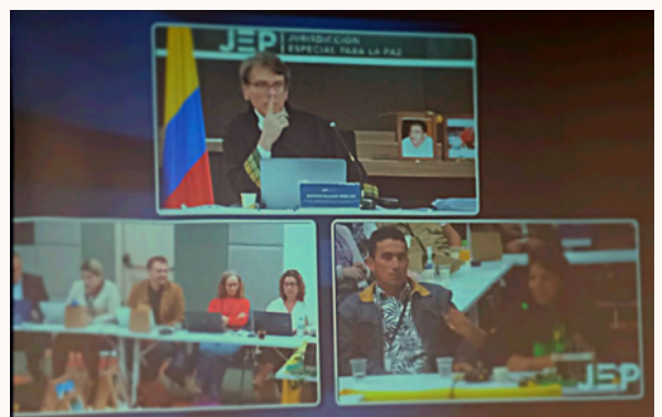
Audiencia Ampliación de Informe región Meta

Para finalizar, cabe decir que todas las declaraciones presentadas durante esta Audiencia, contribuyeron al esclarecimiento de lo ocurrido con la UP, reafirmaron convicciones, fortalecieron los vínculos de las víctimas con el proceso, sus identidades colectivas y reavivaron las memorias políticas, sociales y familiares.