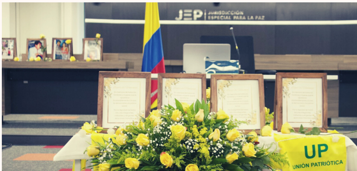
Foto: Audiencia de Ampliación de Informe Caso 06 - JEP. 14, 15 y 16 de junio 2023.

BOLETÍN INFORMATIVO DEL CASO 06 -UP- EN LA JEP - N.13