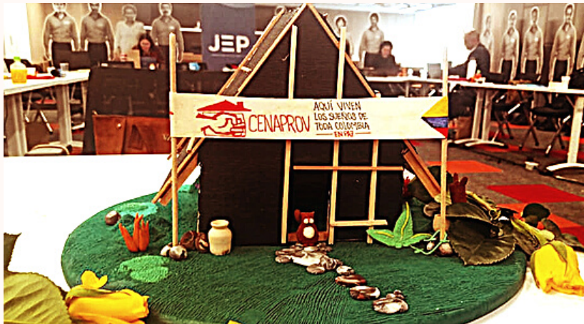
"Esta casa la hicimos sin puerta, esperando que algún día entre la justicia" Lideresa sobreviviente Caso UP. Audiencia JEP. 16 Junio.

Para esta última, Audiencia, fueron seleccionadas las regiones del Tolima, Meta, Guaviare y San José de Apartadó, por su relevancia para ilustrar la violencia perpetrada contra la UP, las modalidades de persecución implementadas, y el involucramiento de los agentes del Estado en la comisión de los crímenes. Así, el informe "Venga esa mano País" establece que "Antioquia, Meta Santander-Magdalena Medio y Tolima reportan el mayor número de víctimas" (p. 19). Además, indica que "territorialmente, no existen diferencias marcadas entre la distribución de los hechos de presunta responsabilidad de la fuerza pública y las regiones de alta victimización: el Urabá, el Ariari-Guayabero (Meta y Guaviare), el Magdalena Medio y el Tolima son víctimas tanto de estructuras paramilitares como de agentes de Estado" (p. 148).