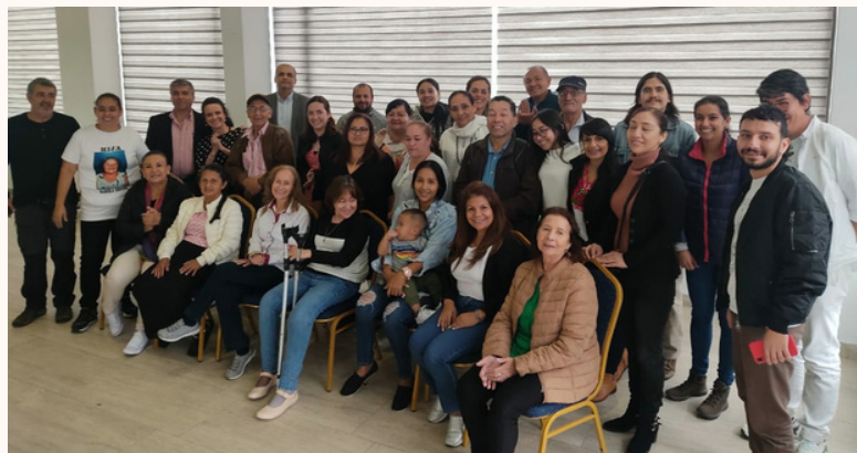
Taller preparatorio a la Jornada de Ampliación de Informe. Regiones Meta, Guaviare y Urabá. Bogotá 2022

En todas las actividades, se tuvo en cuenta la priorización referida en el auto 075 y el énfasis que se hace de la violencia causada por parte de agentes de la fuerza pública. No obstante, atendiendo a los hechos que conocen las víctimas, a sus experiencias, las que relataron en las actividades preparatorias y en las Audiencias de Ampliación, se fortalece el análisis que es necesaria la ampliación de la priorización realizada por la JEP en el Auto 075. En razón de esto, se han venido planteando tres observaciones centrales al mismo: