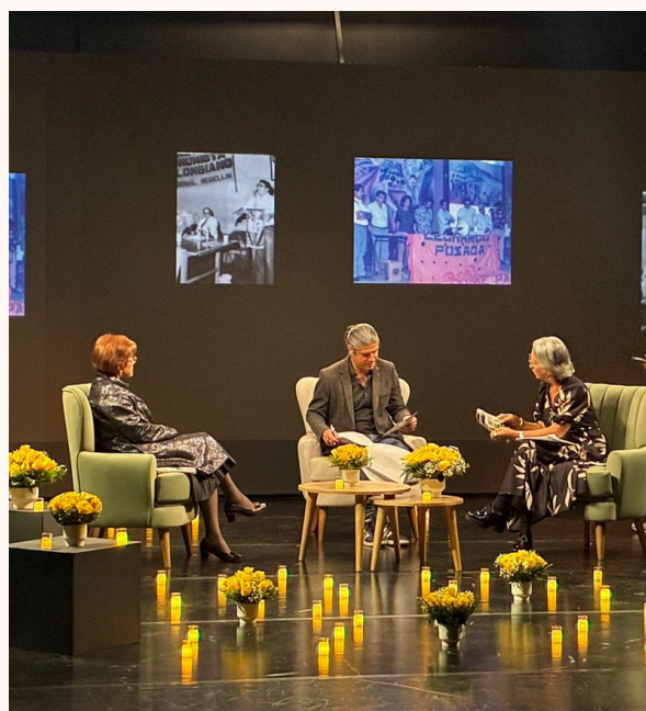
Grabación del programa. 27 de abril.

Los días 5 y 19 de marzo; 9, 15 y 23 de abril; y 7 y 19 de mayo, se realizaron reuniones con RTVC – Sistema de Medios Públicos, para revisar los avances del programa audiovisual relacionado con la medida de publicación del resumen de la sentencia del caso de la Unión Patriótica.