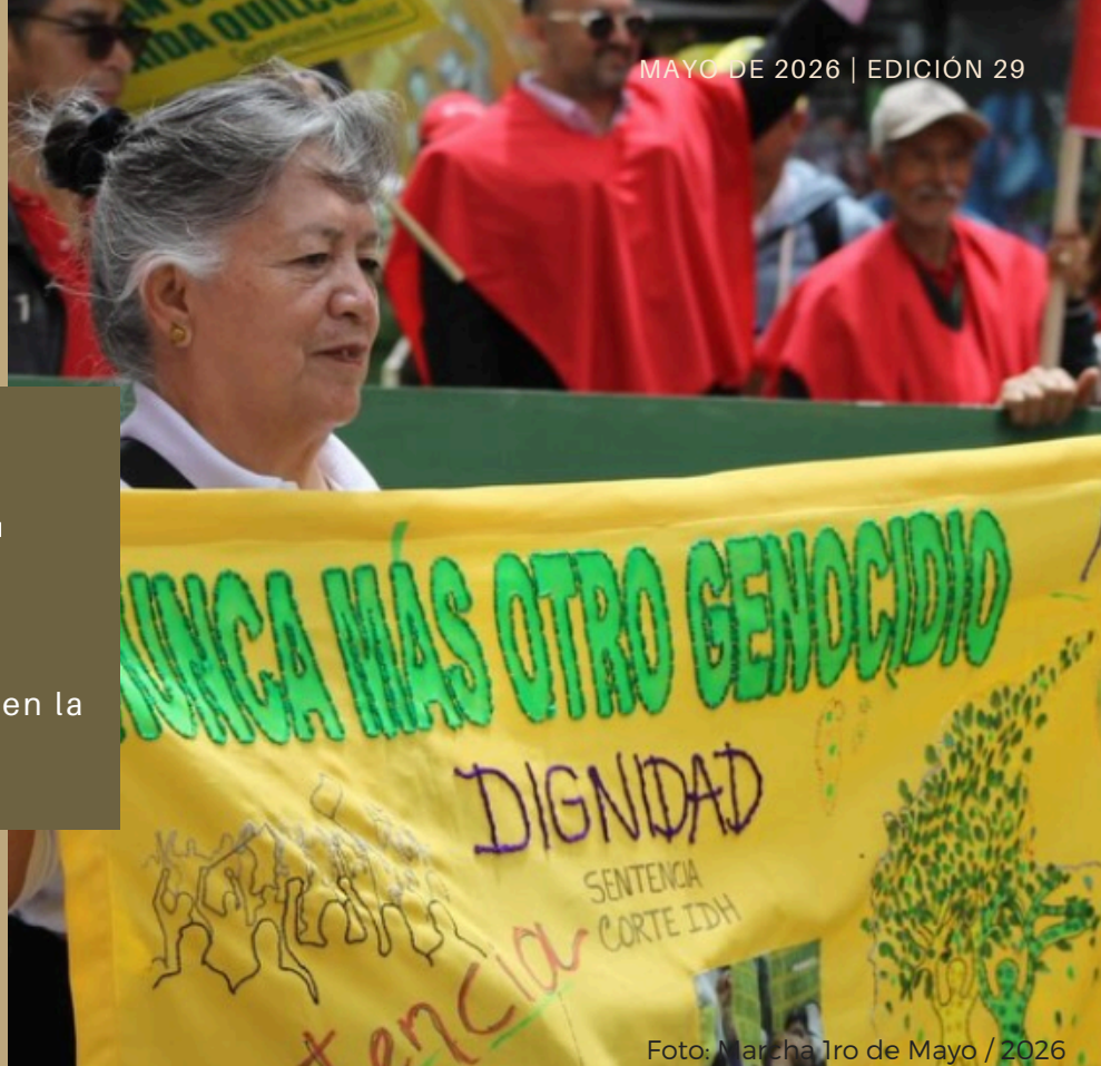
Foto: Marcha 1ro de Mayo / 2026

Boletín informativo del caso 06 -UP- en la Jurisdicción Especial para la Paz