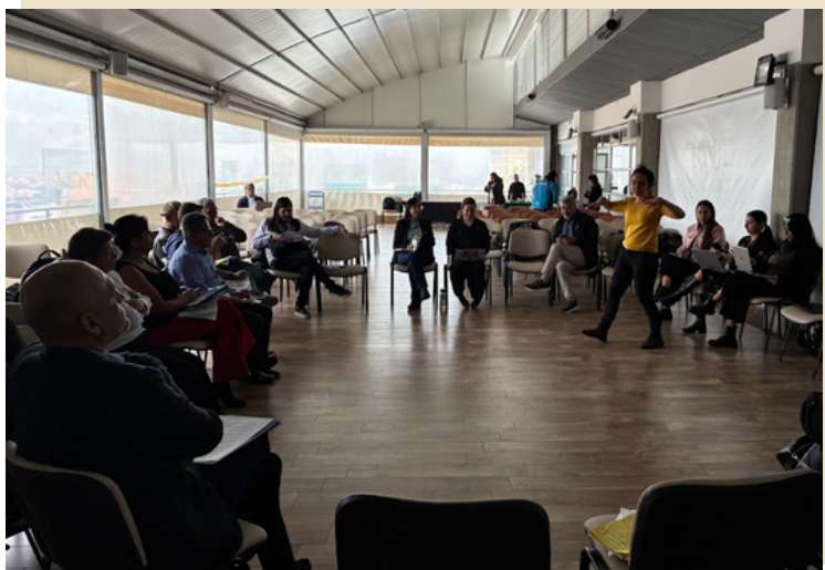
Foto: Taller preparatorio subcaso Inteligencia. Abril 2026

Los antecedentes de esta diligencia se remiten a lo dicho en el Auto No. 075 de 2022, cuando la Sala adoptó e hizo pública la estrategia de investigación y priorización al interior del Macrocaso 06. Allí, la Sala estableció que la investigación se concentraría en varios territorios críticos y en un subcaso de alcance nacional, a través del cual la Sala investigaría la “participación de agentes estatales de inteligencia civil y militar en connivencia con grupos paramilitares y oficinas de sicarios” en la ejecución de crímenes en contra de integrantes de la Unión Patriótica. Este se ha denominado el “subcaso de inteligencia militar”.