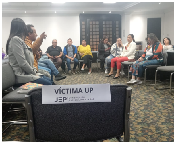
Foto: Taller preparatorio subcaso Inteligencia. Mayo 2026

En la instrucción del subcaso de inteligencia militar, ha surgido que miembros de las unidades militares señaladas no solo tuvieron una presunta participación en violaciones a los derechos humanos de integrantes de la UP, sino también en contra de personas cuyos crímenes fueron referidos en un informe presentado por el Colectivo de Abogados José Alvear Restrepo, la Comisión Intereclesial de Justicia y