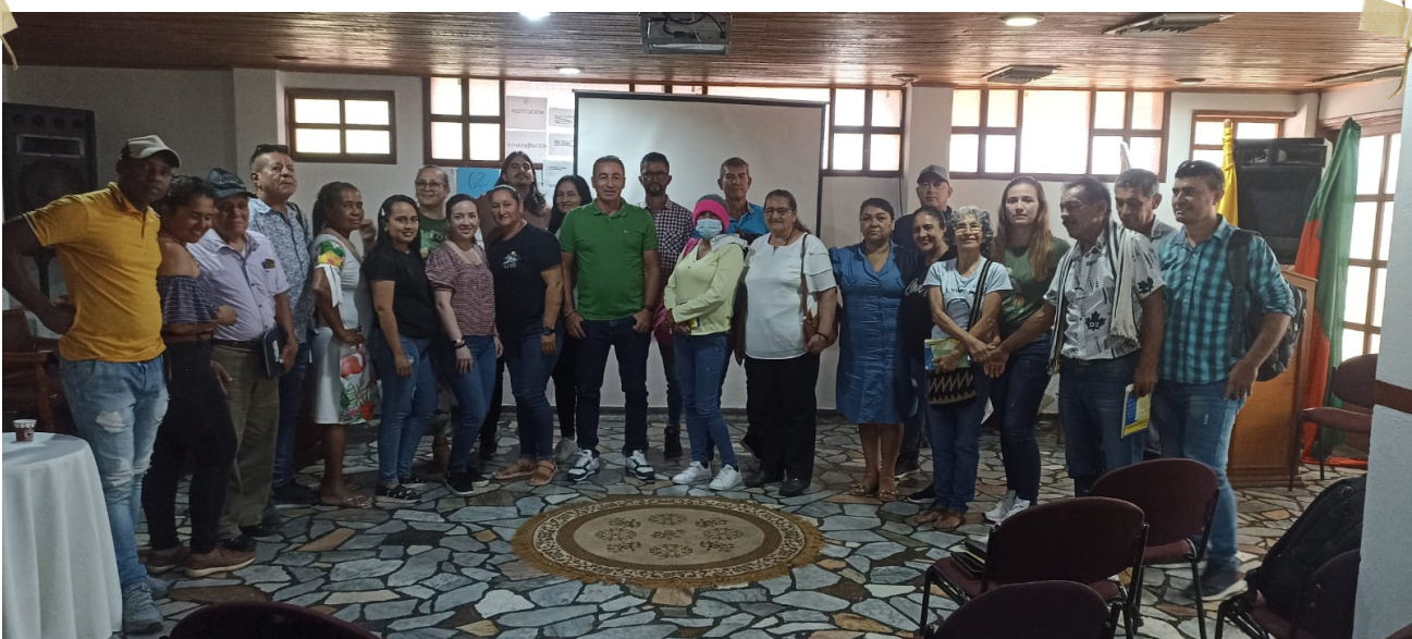
TALLERES DE FORMACIÓN CON INTEGRANTES DE LAS COORDINACIONES DE CAUCA Y ARAUCA (ARRIBA), Y CÓRDOBA (ABAJO)