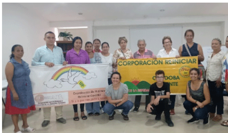
TALLER EN MONTERÍA, CÓRDOBA