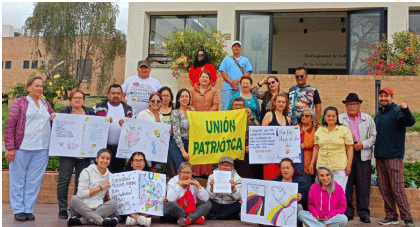
TALLER EN FUSAGASUGÁ CON LAS COORDINACIONES DE BOGOTÁ Y CUNDINAMARCA

La sentencia de la Corte IDH ha ordenado la implementación de las medidas de rehabilitación, referidas a la mitigación de los daños a la salud física y mental causados por el exterminio de la UP. Ante la necesidad de que estas medidas sean implementadas de la manera más rápida posible, el equipo psicosocial de la Corporación Reiniciar ha venido desarrollando una serie de talleres en distintas regiones del país con dos finalidades: