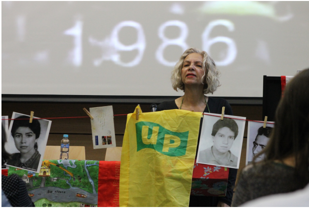
ACCIÓN PERFORMÁTICA REALIZADA DURANTE EL COLOQUIO 'ARCHIVOS: ENTRAMADOS Y TRANSFORMACIONES POLIFÓNICAS DE LA MEMORIA EN COLOMBIA'. UNIVERSIDAD JAVERIANA.