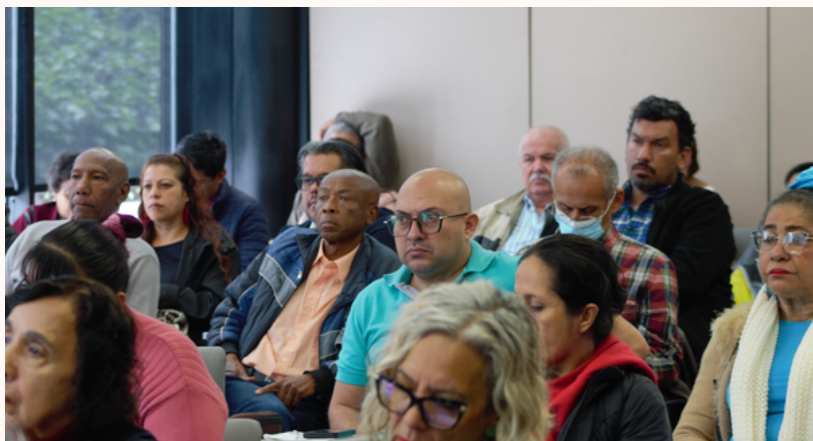
Seminario TOAR. 2 y 3 Marzo, Centro de Memoria Bogotá 2023

En este sentido, los días 2 y 3 de marzo del presente año, se adelantó junto a un grupo de víctimas proveniente de distintas zonas del país y acreditadas en el Caso 06, el Seminario " Proyecciones, posibilidades, alcances y límites de los TOAR en el Caso UP en la JEP ". El objetivo central del encuentro fue comprender los alcances de la reparación en la JEP a través de los Trabajos, Obras y Actividades con contenido Restaurador-Reparador (TOAR), acercándose a partir del conoci-